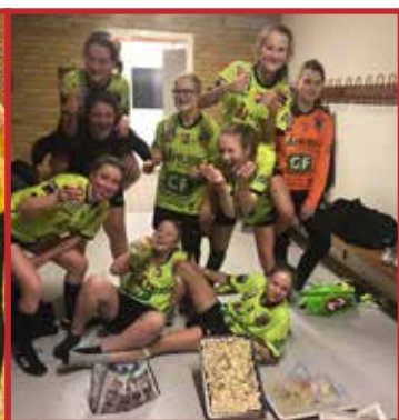
U14 som har vundet kredsmesterskabet i B række