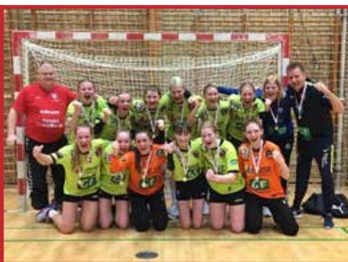
U14 der vandt Vidar cup