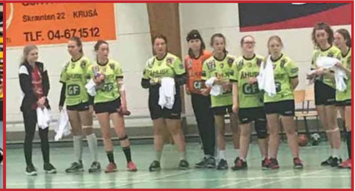
U14 der blev nummer 2 i Grænse cup