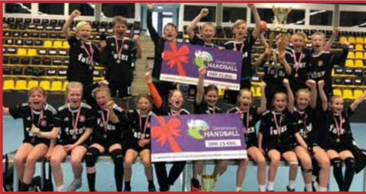
U10 der vandt JM i pige rækken