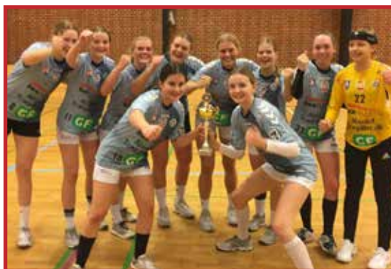
Efter en lang og god sæson er U 16 pigerne fra Sønderjyske ungdom klar til jysk mesterskab i U16 1 division B