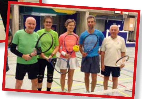
En gruppe seniorer der spiller minitennis lørdag formiddag