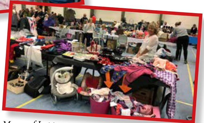
Masse af Lopper