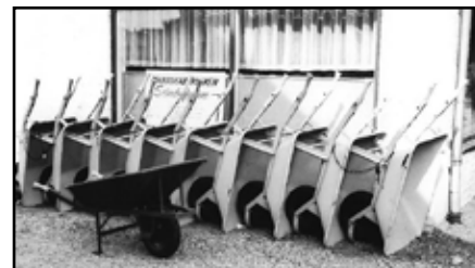
Vestergade 17, Trillebør