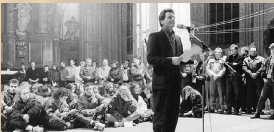
Bøn i Rostock Marienkirche med præsten Joakim Gande (senere Forbundspræsident)

te år fejrer vores danske venner, slægter og naboer Danmarks genforening for 100 år siden. Vi glæder os med jer og fejrer med. Året erindrer os også om Slesvigs deling. Dengang opstod en grænse, som aldrig virkelig adskilte mennesker. Det var godt, at menne-