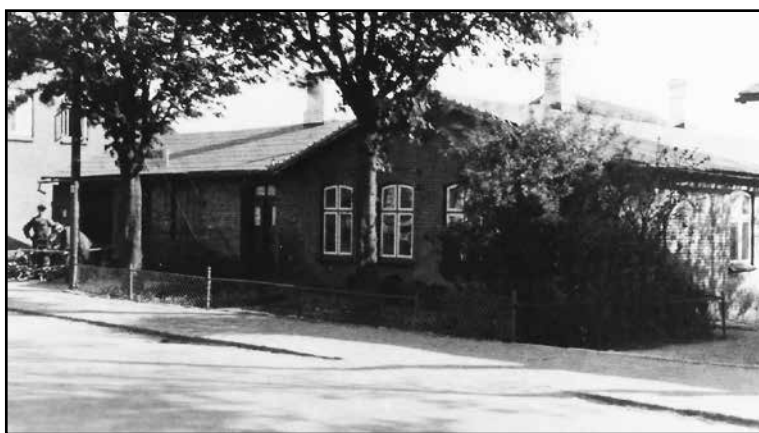
Vestergade 17 (Straagaard's smedie 1924-42)