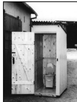
Vestergade 17 Toilet vogn

I 1962 starter H.P. Jørgensen produktionen af Sønderjyden skurvogne som pga. pladsmangel flytter virksomheden til Industrivej 3 hvor hal 1 (1500 m 2 ) bygges i 1967 og så går det stærkt, i 1971 hal 2 (1.000 m 2 ) og derefter hvert