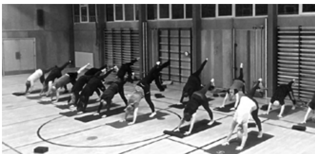
Yogaøvelsen "den trebenede hund"

Der meldes fuldt hus og rigtig god stemning på de 2 nyoprettede yoga hold, som begge er kommet rigtig godt fra start. Yoga er virkelig for alle, det vidner aldersspredningen fra 20 - 72 år om. "Det er simpelthen en fornøjelse at arbejde med alle der er tilmeldt vores hold" fortæller instruktørerne Camilla og Janne