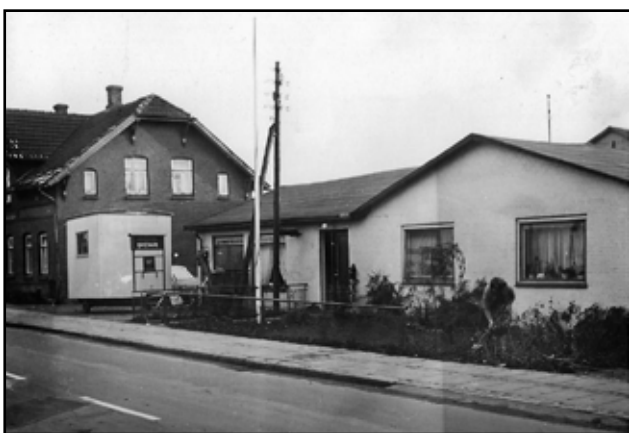
Vestergade 17, Sønderjyden