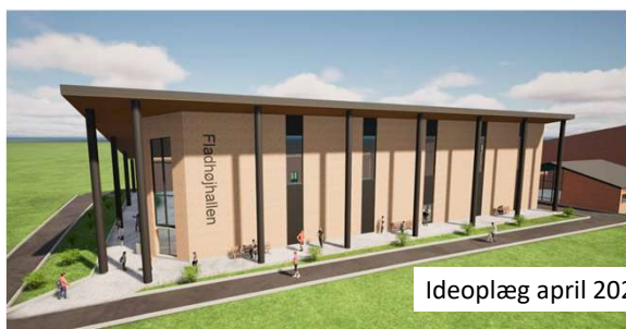
Ideoplæg april 2026