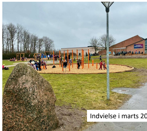
Indvielse i marts 2026