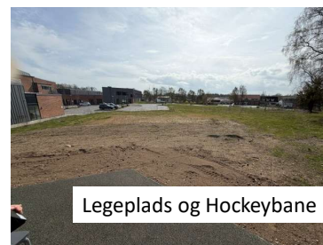
Legeplads og Hockeybane