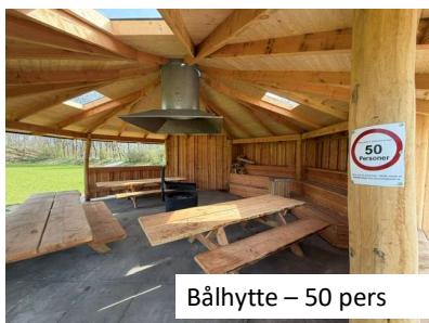
Bålhytte – 50 pers